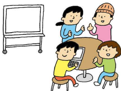
グループでの 準備の仕方