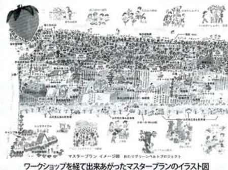
ワークショップを経て出来あがったマスタープランのイラスト図

この度、わたりグリーンベルトプロジェクトの活動の一環として熱気球フェスティバルを催します。4機の熱気球が亘理町の子供たちや大人たちを乗せて空に舞い上がります。これから復興される防潮林と農地を空から眺め、震災で何を失ったのか、これからどんな未来をつくるのか、そのために今何が必要なのか、“亘理町の未来”について考えてみませんか。