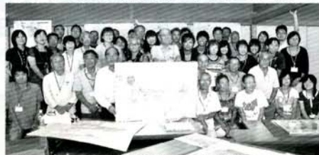
マスタープランを囲み、亘理町長(前列左から4番目)と参加者で写真を撮りました