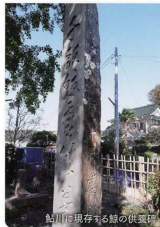
鮎川に現存する鯨の供養碑

鮎川における小型沿岸捕鯨の特徴は、この種の捕鯨業が地域に深く根ざした産業であり、そこに住む人にとって誇るべき地域文化の基礎をなしている事である。鯨は欠かせない食料資源であり、また鯨の捕獲、解体、流通、消費に至る一連の活動は、地域の人々の日々の生活と切り離す事が出来ない。本講演では、1987年から1996年にかけて行われた文化人類学調査を中心に、鮎川における小型沿岸捕鯨業の社会・文化的重要性について報告する。