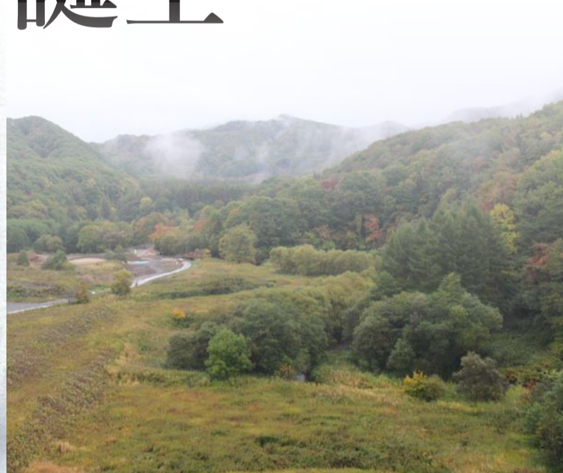
厚真町幌内 アイヌ文化成立期の遺跡が広がる