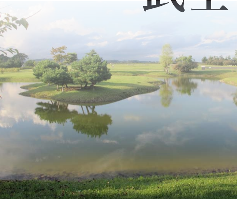
岩手県平泉町柳之御所遺跡 復元された池