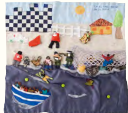
「フェンスの向こう側」アントニア・アマドル、2015年