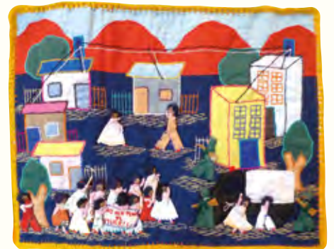
「死刑制度反対」作者不明、1990年 ©大島博光記念館

貧困地区の日常風景、抑圧的な体制への抵抗、あるいは失った人への思いを描く作品を通じて、アルピジェラのエッセンスに触れます。