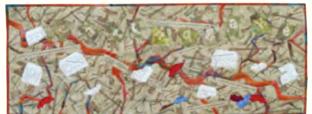
「震災の三部作」より「地震」アイリーン・マクウィリアム、2012年