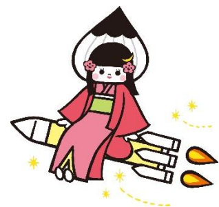
角田市PRキャラクターおふで

角田の色々をチェック出来る『ココカクダ』 3日目の市内見学スポット探しにもお役立てください！！